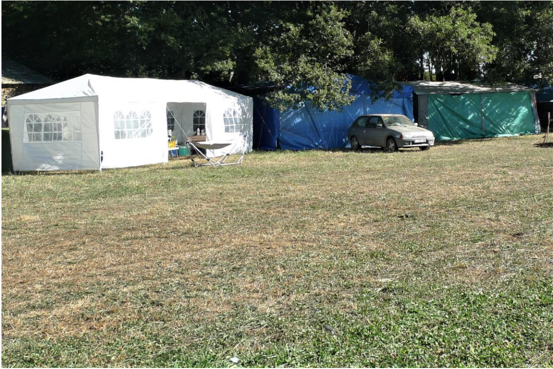
TENDAS COLOCADAS PRETO DO RECINTO DA FESTA PARA PASAR A ROMAXE.