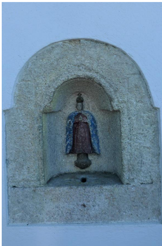
ESMOLEIRO Á ENTRADA DO SANTUARIO

A relixiosidade popular ten, ademais dunha dimensión práctica, un compoñente de pacto baseado na reciprocidade, que esixe do devoto a entrega dalgún ben para propiciar ao ente sacro ou para compensalo polo favor recibido. Por iso é común que se depositen diversas ofrendas no interior do templo. Unha moi xeral é a dos “velóns de cera” –cirios pequenos- que os fieis adquiren a un euro e, logo, colocanos acesos nun pequeno altar, adicado a advocación dos Remedios e situado no lado exterior dereito do recinto sacro; no ano 2013 houbo unha ofrenda no conxunto dábolos dous días duns 1000 velóns. Outra oferta son as esmolas en metálico, que os fieis adoitan depositar nalgunha das tres boetas de que está provisto o santuario. Asi mesmo, hai devotos que ofrecen estipendios en misas, cada unha das cales vale 6 euros. Nábolos dous días de festividade, houbo unha ofrenda aproximada de 700 misas, que os dous frailes mercedarios de Sarria,- encargados do santuario-, soen