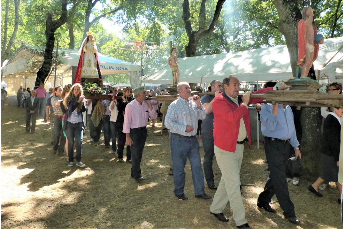
DETALLE DA PROCESIÓN