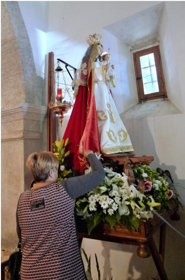
RITUAL DE CONTACTO COA ADVOCACIÓN MARIANA

Os días 8 e 9 de setembro conmemórase a festividade desta advocación mariana. Acoden devotos de Lugo capital, do concello de Sarria e doutros municipios limítrofes como Samos, Láncara, O Incio. Os devotos ofrécese normalmente por si mesmos mais hai algúns casos nos que veñen en nome doutras persoas que, polas súas doenzas, non poden acudir á romaría.