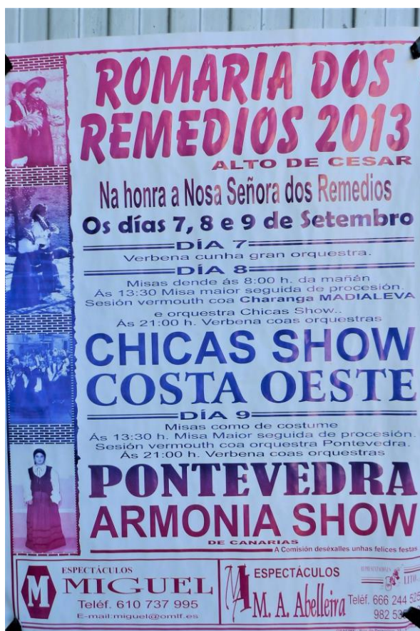
CARTEL DA ROMARÍA

venera la imagen o una reliquia de la Divinidad, de la Virgen o de un santo de especial devoción» 4 . Éstes adoitan acudir ben dun xeito individual ou colectivo para suplicar á divindade a súa mediación ante unha serie de rogativas de índole material (sandar, obter boas colleitas, rogo polos recen nados...) e, algunhas -ás menos- de carácter espiritual; tamén veñen para cumprir coas promesas ofrecidas, logo de que a entidade sacra lles outorgase as peticións requeridas. «Los santuarios son percibidos como espacios sagrados, de los cuales irradia la salud material o espiritual, y a los que se acude de forma individual o colectiva» 5 .