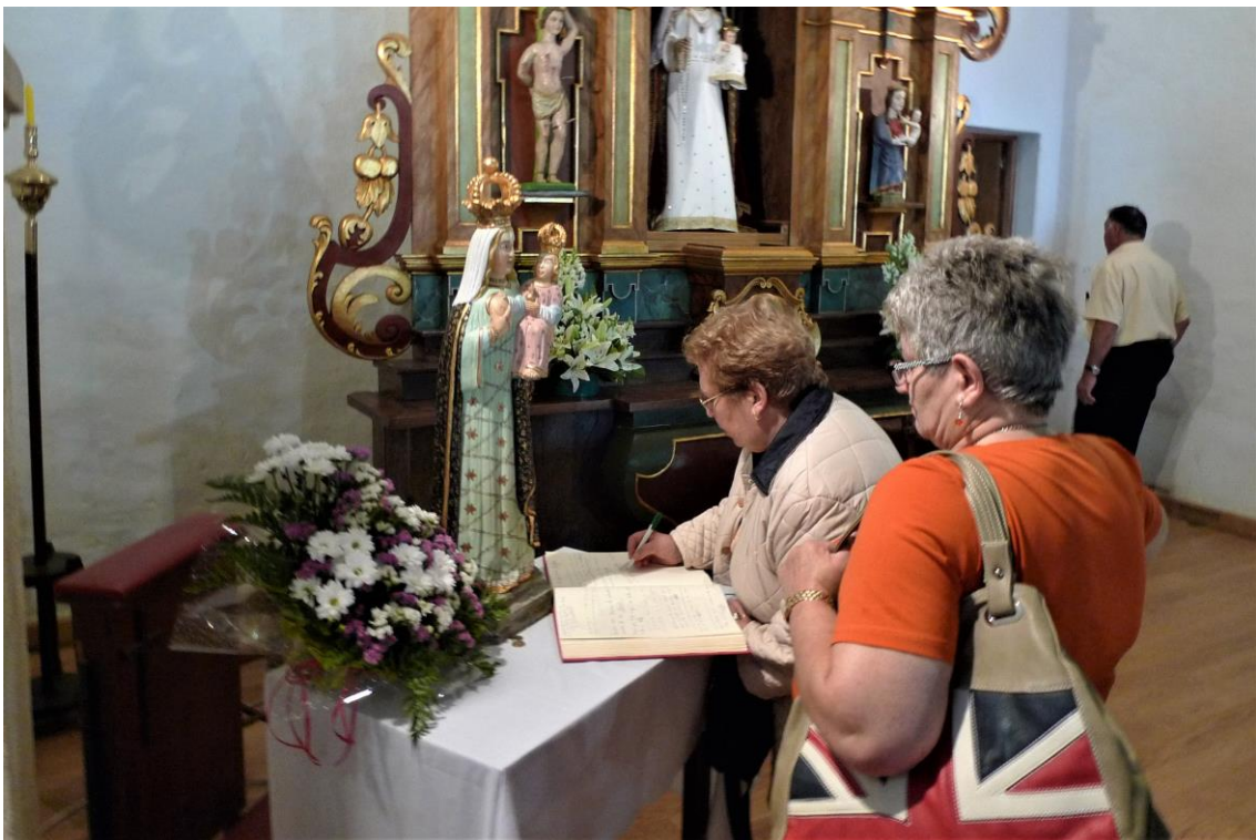
LIBRO DE PETICIÓN