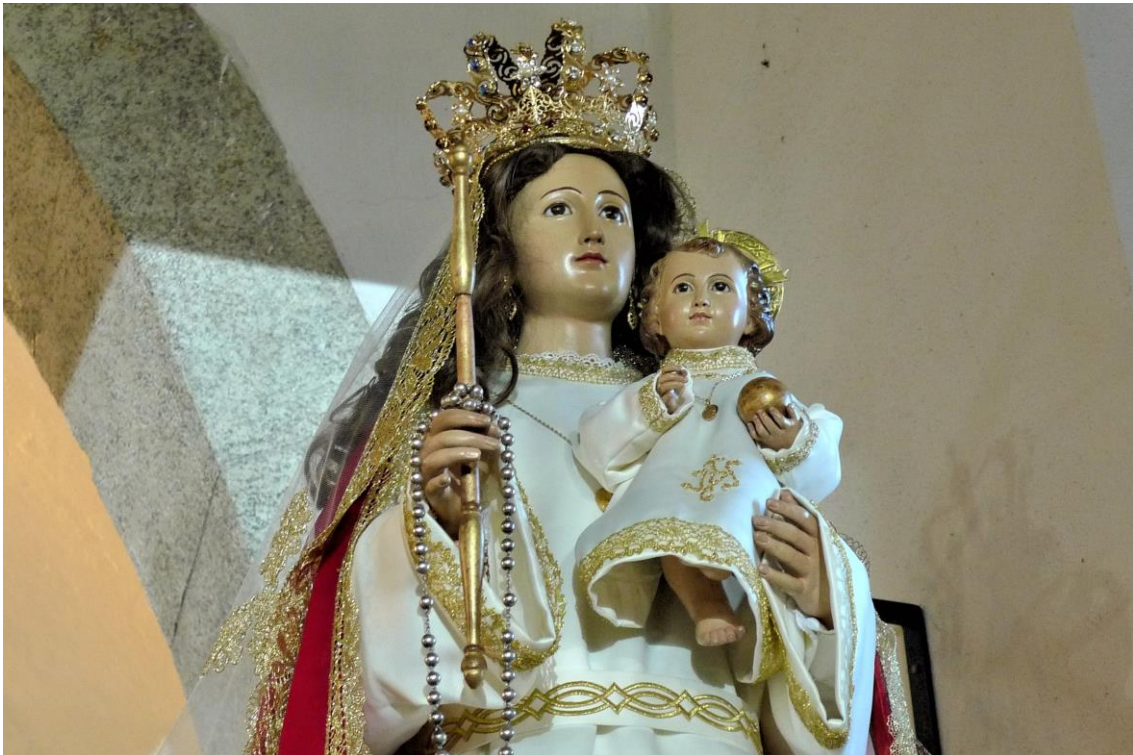
DETALLE DA ADVOCACIÓN MARIANA