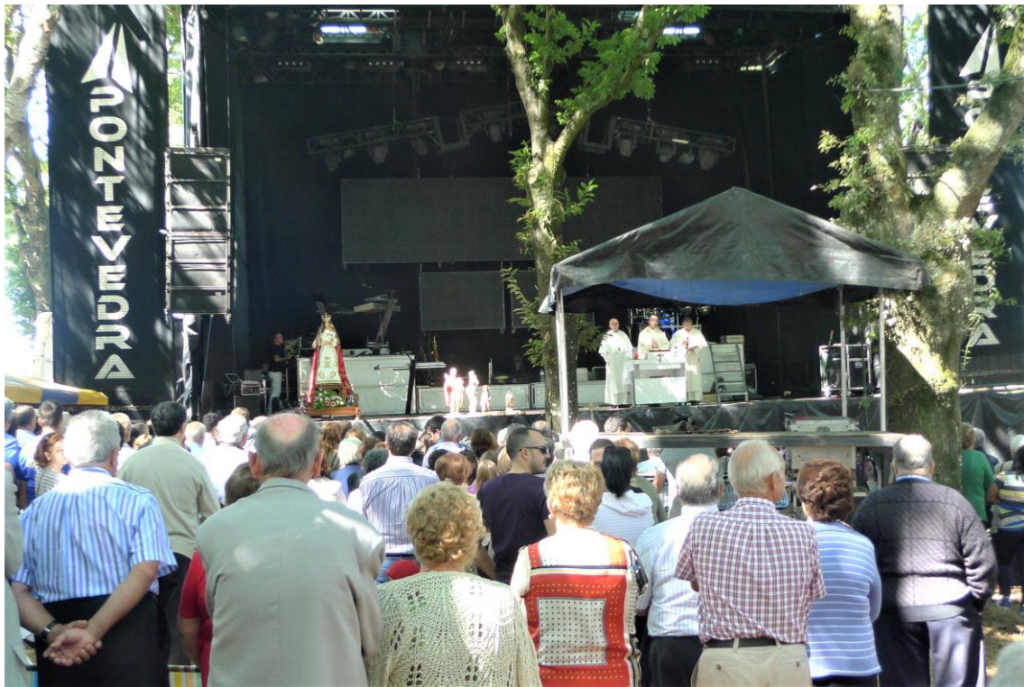
MISA SOLEMNE CONCELEBRADA NO EXTERIOR DO SANTUARIO