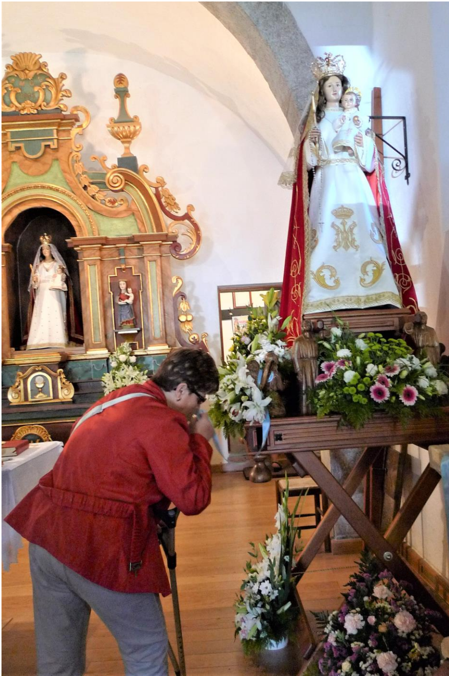
RITUAL DE CONTACTGO COA ADVOCACIÓN MARIANA