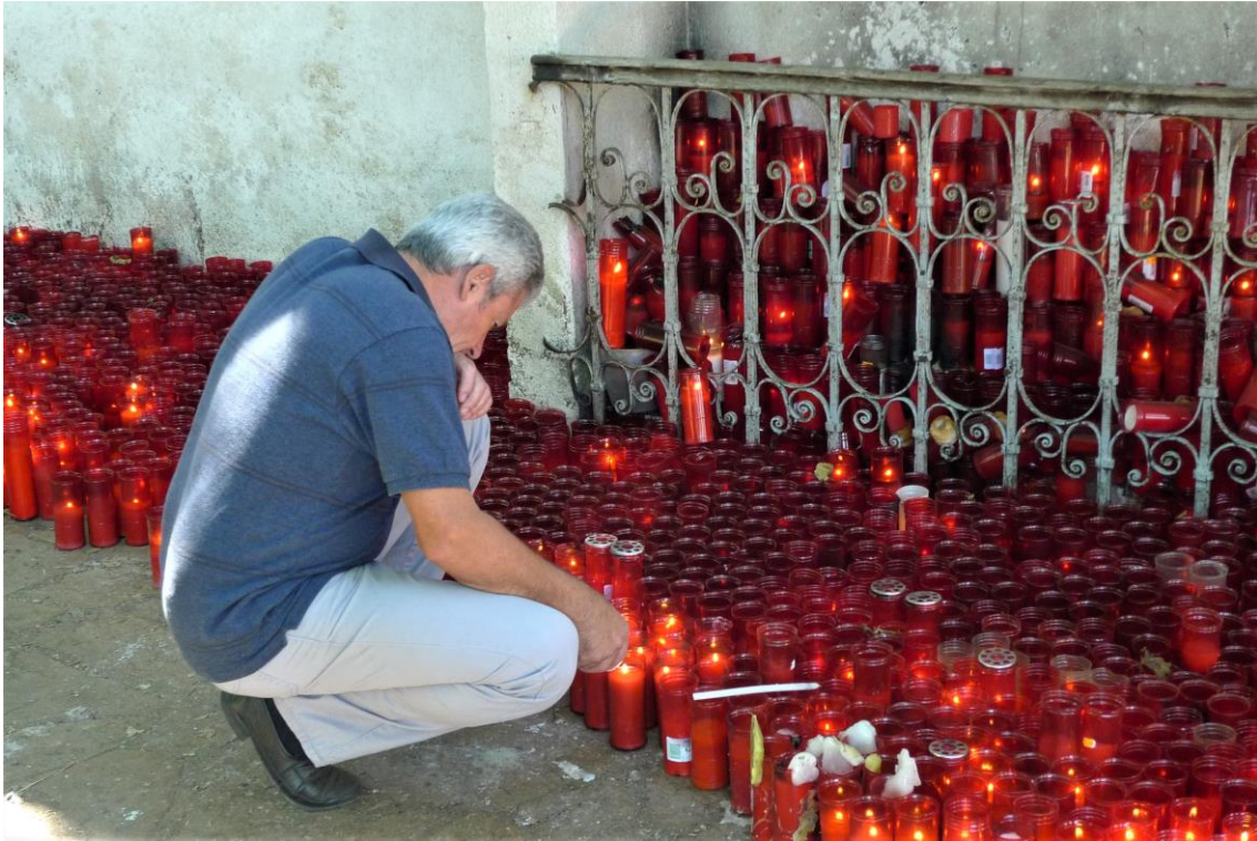
OFRENDA DE VELÓNS NO EXTERIOR DO SANTUARIO